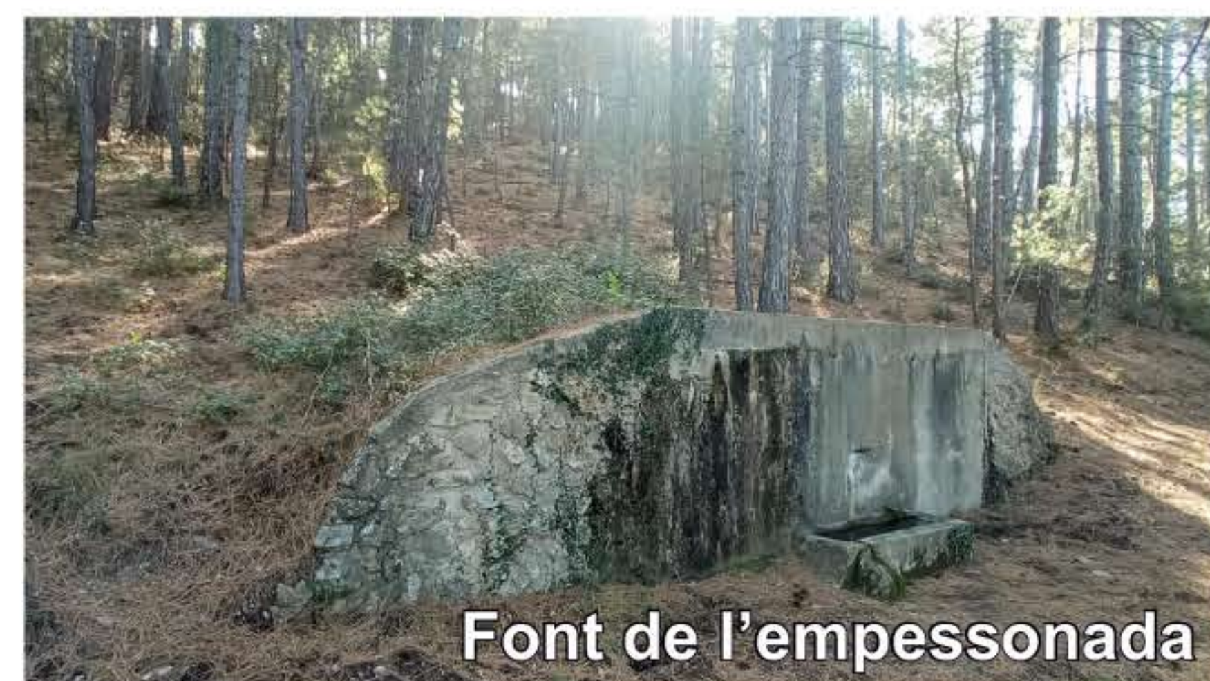
Font de l'empessonada